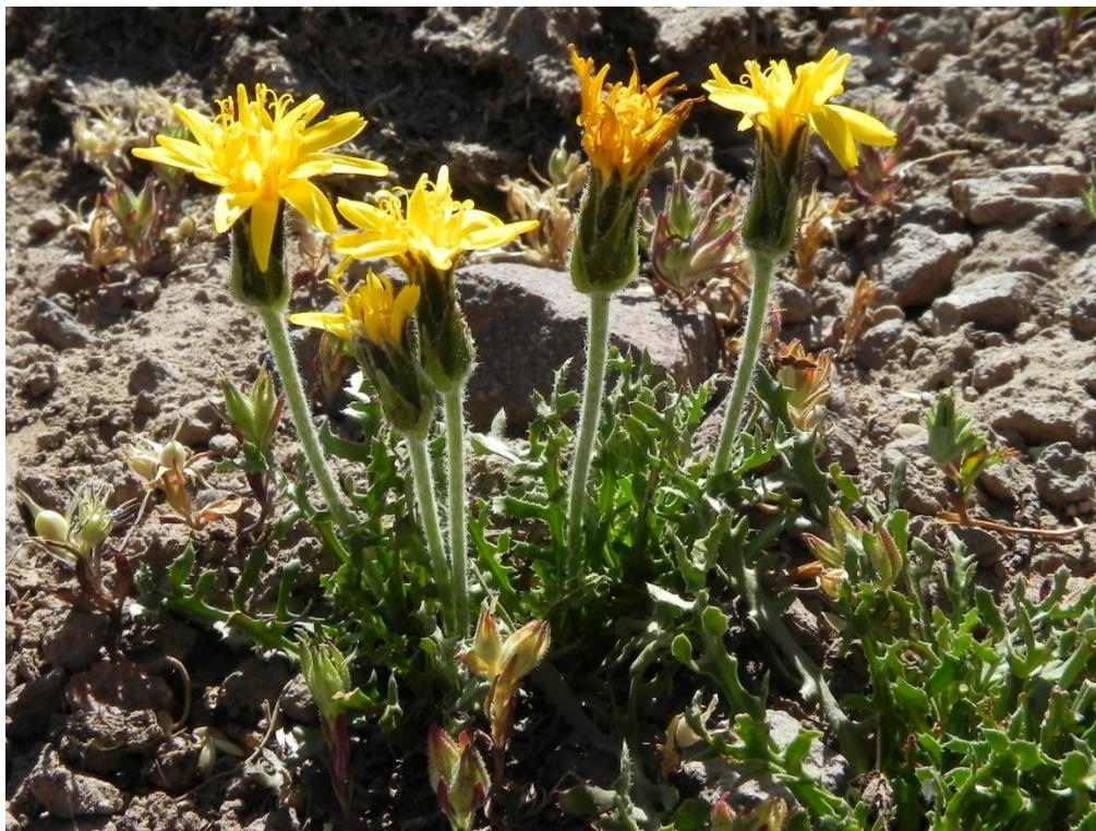
Figura 1. Fotografía de Hypochaeris clarionoides