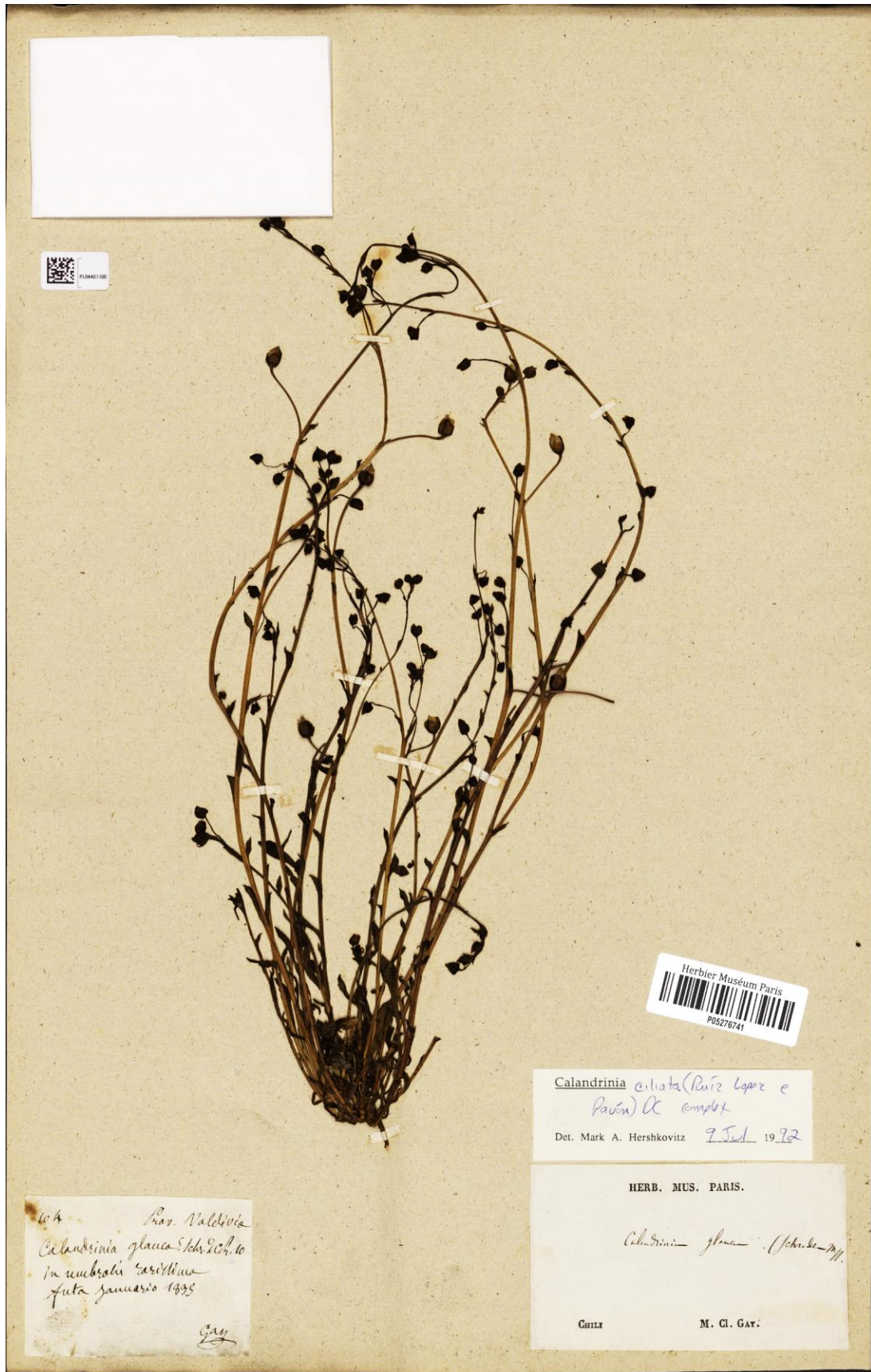
Figura 1. Holotipo de Calandrinia jompomae [C. Gay 104 (P [P05276741])].